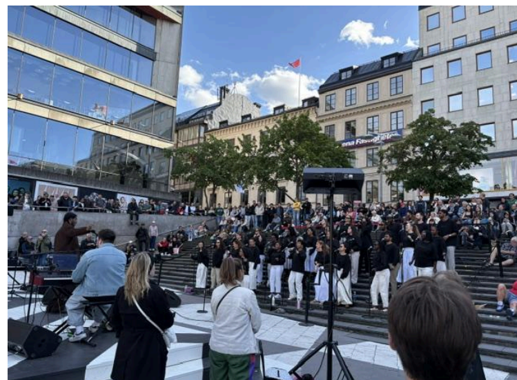
Tensta Gospel Choir sjunger på Sergeltrappan. Firar 30 årsjubileum